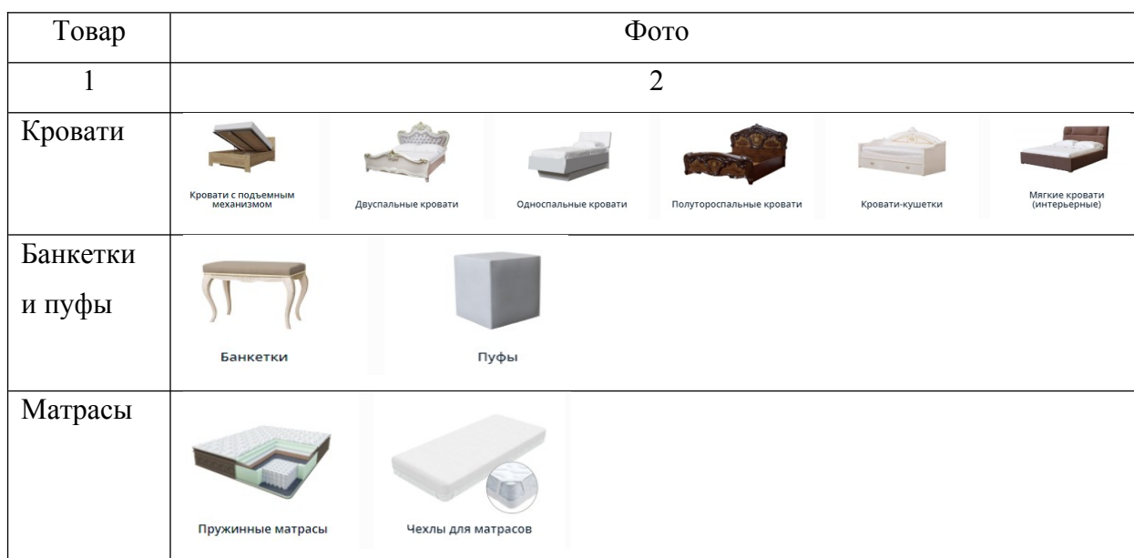
Таблица 8 – Ассортимент ООО «МФ ИнтерДизайн»

ООО «МФ ИнтерДизайн» предлагает следующий ассортимент, таблица 8.